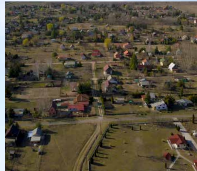
Strand- és gyógyvizes termálfürdő környékén 1300 üdülő található, amely szép környezetben várja a kikapcsolódni vágyókat.

Tápiószentmárton központi belterületétől keletre, a Sőregi földek térségében alakult ki a község üdülőterülete. A terület létrejötté a hatvanas évekre vezethető vissza.